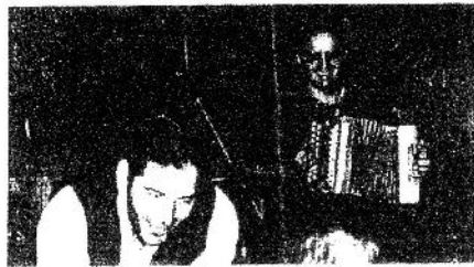
Les interprètes ont su faire du public un véritable complice.

Après un repas organisé par l'association « Vivre en Pays d'Orne », les convives ont fait place au spectacle. Un spectacle chaleureux et inédit de « La compagnie Octobre » qui s'est fondue dans l'ambiance familiale de cette soirée.