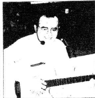
Animonde, une soirée en musique

Comme toujours, le Printemps Littéraire est l'occasion de proposer un spectacle aux enfants des maternelles de Montagne et des environs. Jeudi et vendredi dernier, des dizaines de bambins sont venus à la salle des fêtes de Montagne pour voir "Animonde" avec Ti Pierre et Cocodrille qui ont provoqué d'immenses éclats de rire de côté et d'autre. Tous heureux de cette récréation qui fait le tour du monde des animaux, les petits ont aussi été associés à ce Printemps.