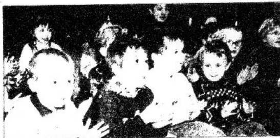
Les petits de maternelles ont été captivés par le spectacle

Comme toujours, le Printemps Littéraire est l'occasion de proposer un spectacle aux enfants des maternelles de Montagne et des environs. Jeudi et vendredi dernier, des dizaines de bambins sont venus à la salle des fêtes de Montagne pour voir "Animonde" avec Ti Pierre et Cocodrille qui ont provoqué d'immenses éclats de rire de côté et d'autre. Tous heureux de cette récréation qui fait le tour du monde des animaux, les petits ont aussi été associés à ce Printemps.